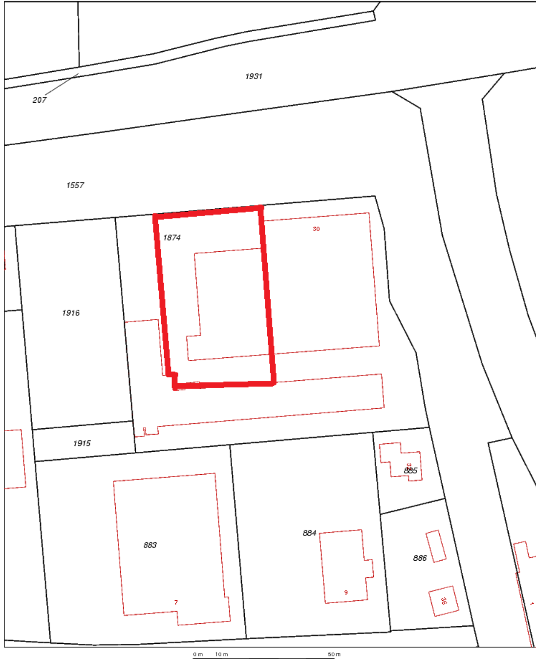
Uittreksel Kadastrale Kaart